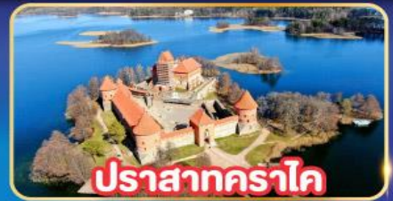
ปราสาทคราโด

พิเศษ! เที่ยวเก็บครบทุกประเทศยุโรปเหนือ ลิทัวเนีย , ลัตเวีย , เอสโตเนีย , ฟินแลนด์