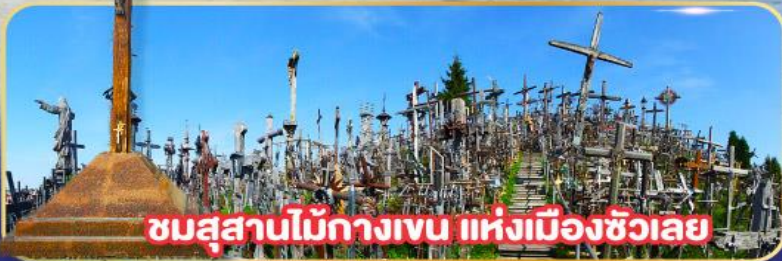
ชมสุสานไม้กางเขน แห่งเมืองซิวเลย์