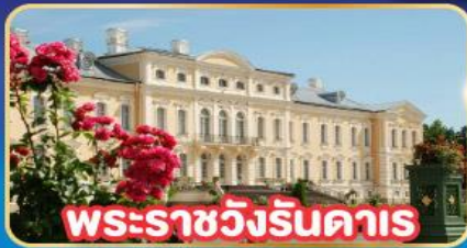
พระราชวังรินดาร์