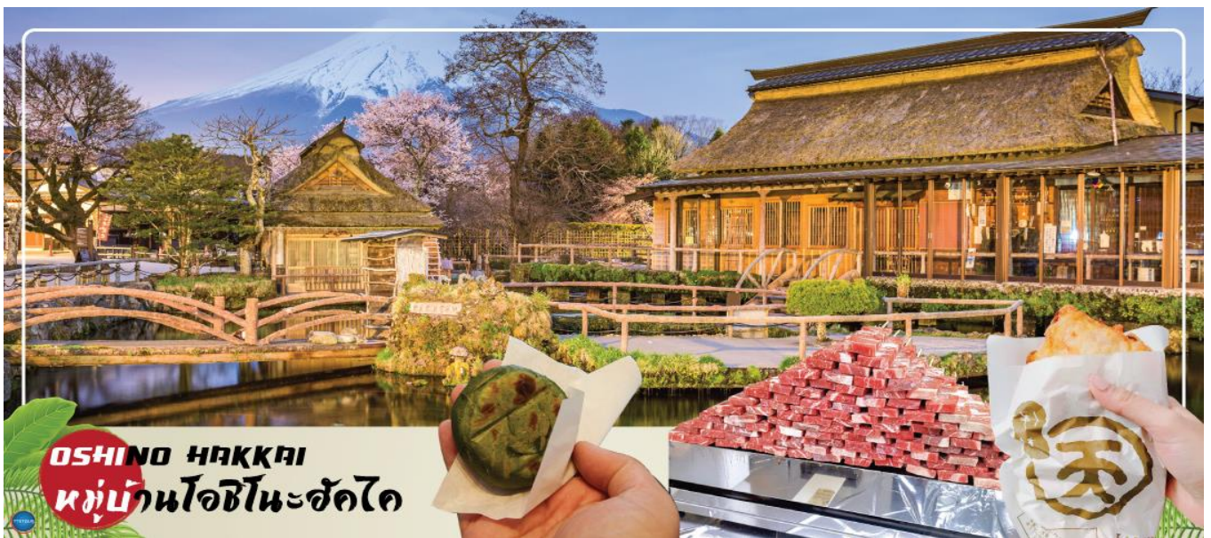
OSHINO HAKKAI หมู่บ้านโอชิโนะฮัคไค

ได้เวลาอันสมควรนำท่านเดินทางสู่ หมู่บ้านโอชิโนะฮัคไค (Oshino Hakkai) ให้ท่านเจาะลึกตามหาแหล่งน้ำบริสุทธิ์จากภูเขาไฟฟูจิ ที่เป็นแหล่งน้ำตามธรรมชาติตั้งอยู่ในหมู่บ้านโอชิโนะ จ.ยามานชิ หรือพูดในทางกลับกันคือกลุ่มน้ำผุดโอชิโนะฮัคไค เพียงก้าวแรกที่ย่างเท้าเข้าไปในหมู่บ้านก็สัมผัสได้ถึงอากาศบริสุทธิ์ และไอเย็นจากแหล่งน้ำธรรมชาติที่มีให้เห็นอยู่ทุกมุม โดยในบ่อน้ำใสแจ๋วมีปลาหลากหลายพันธุ์แหวกว่ายอย่างสบายอารมณ์ แต่ขอบอกเลยว่าน้ำแต่ละบ่อนั้นเย็นจับใจจนแอบสงสัยว่าน้องปลาไม่หนาวสะท้านกันบ้างหรือ เพราะอุณหภูมิในน้ำเฉลี่ยอยู่ที่ 10-12 องศาเซลเซียสนอกจากชมแล้วก็ยังมิน้ำผุดจากธรรมชาติให้ดกดื่มตามอัธยาศัย และที่สำคัญ หมู่บ้านโอชิโนะยังเป็นแหล่งช้อปปิ้งสินค้าโอท็อปชั้นเยี่ยมอีกด้วย