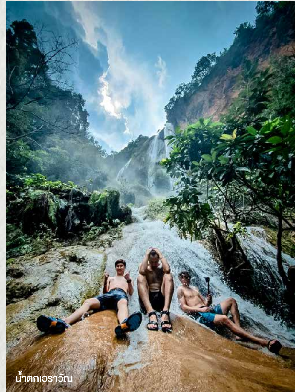
น้ำตกเอราวัณ

14.00 น. กลับลงมาจากน้ำตก อิสระมือกลางวัน