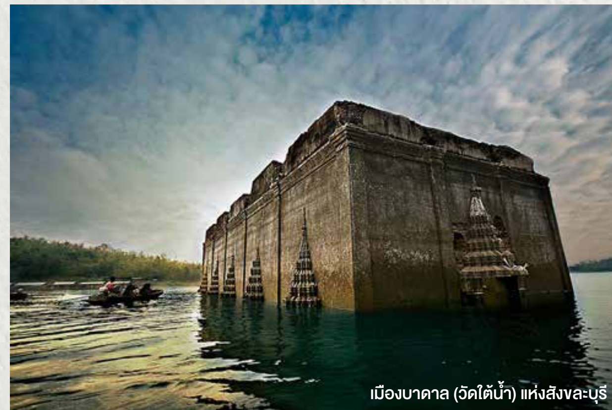
เมืองบาดาล (วัดไถ่น้ำ) แห่งสังขละบุรี

16.30 น. ขึ้นฝั่ง และ นำท่านเข้าที่พัก Check in ณ สามประสบรีสอร์ทที่พักผ่อนตามอริยาศัย อิสระมือเย็น