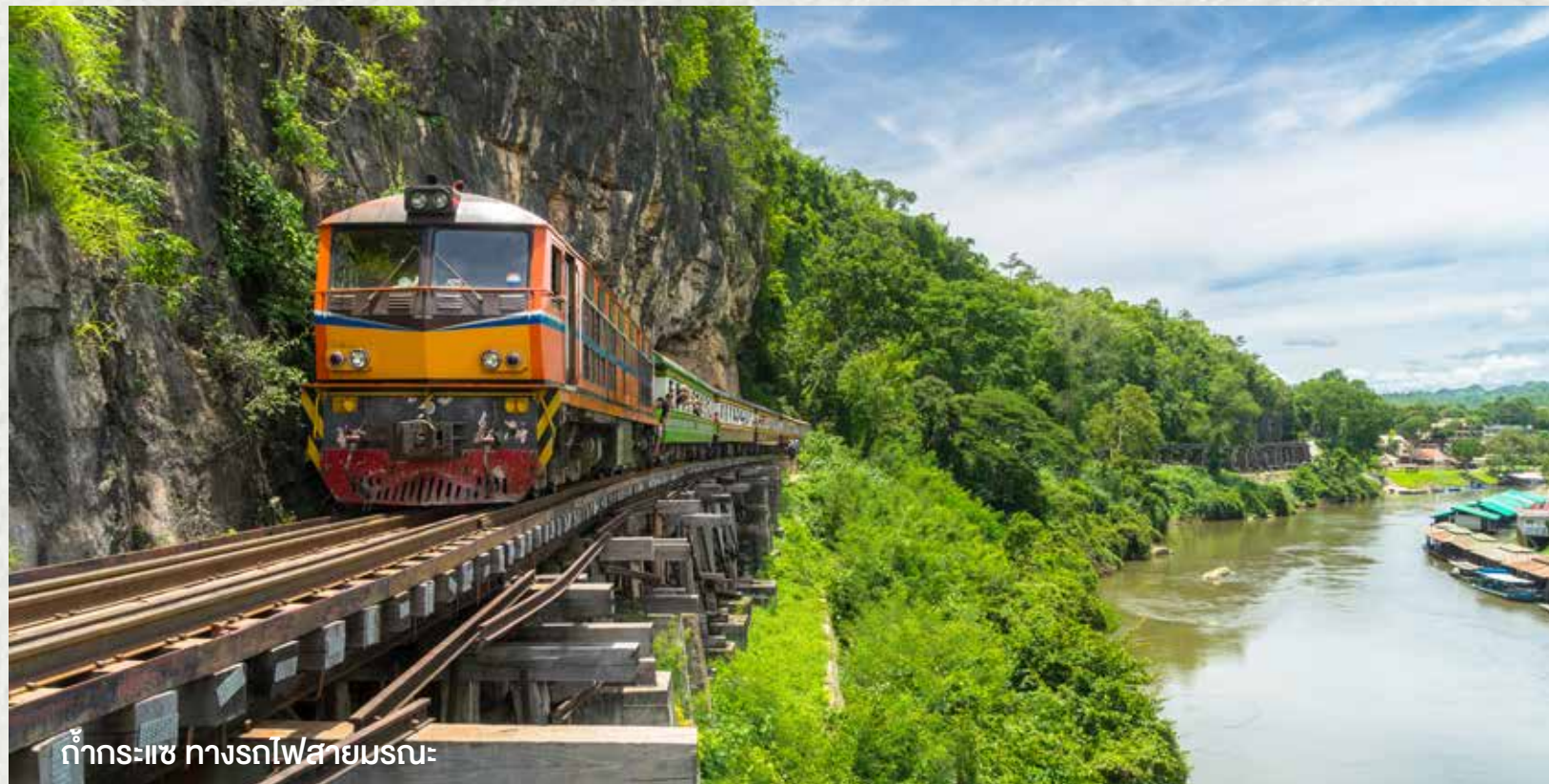
ท่ากระแซ ทางรถไฟสายมรณะ