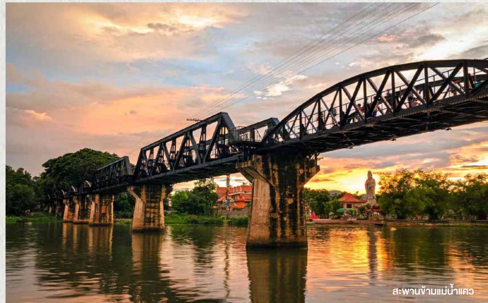
สะพานข้ามแม่น้ำแคว

21.00 น. เดินทางกลับถึงกรุงเทพฯ โดยสวัสดิภาพ