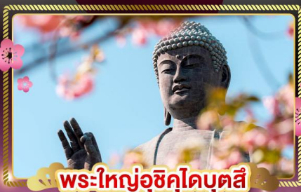
พระใหญ่อุซึคุโดบุตสึ