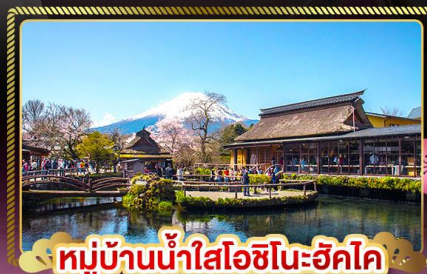
หมู่บ้านน้ำใสโอชิโนะฮักโค