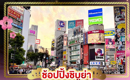
ช้อปปิ้งชิบูย่า