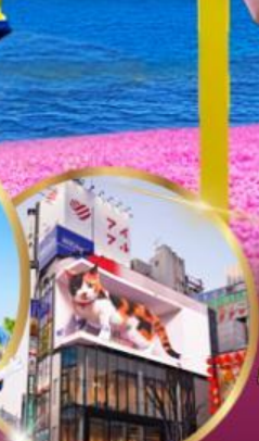
ช้อปปิ้ง ย่านชินจูกุ