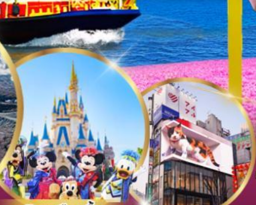
อิสระเลือกซื้อ Tokyo Disneyland