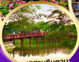
ทะเลสาบคินคาว