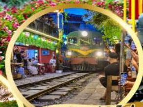
ร้านค้าแฟรตโพ