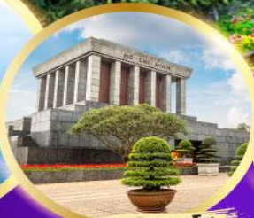
สุสานลุงโฮ