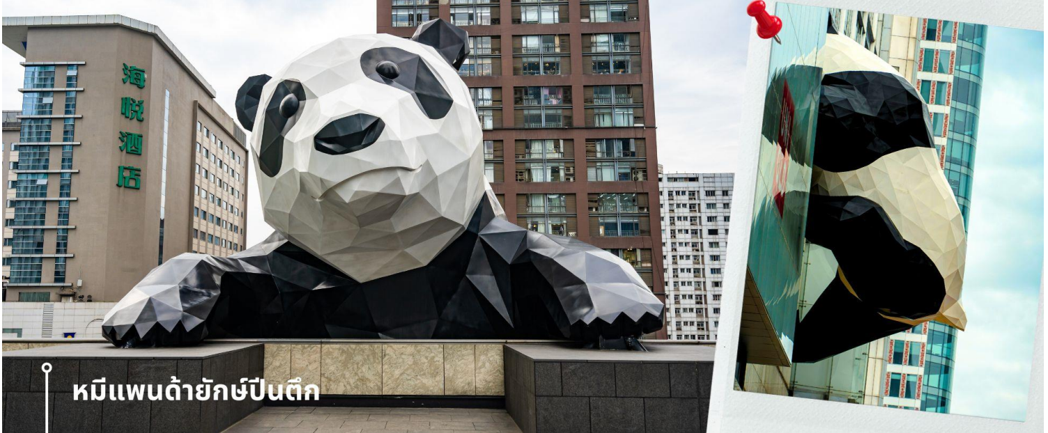
หมีแพนด้ายักษ์ปิ่นตึก

ปิ่นตึก และมีส่วนหัวที่โผล่พ้นออกมาจากอาคาร ทำให้เกิดภาพอันน่ารักและน่าประทับใจจากผู้ที่ได้พบเห็นและนักท่องเที่ยว