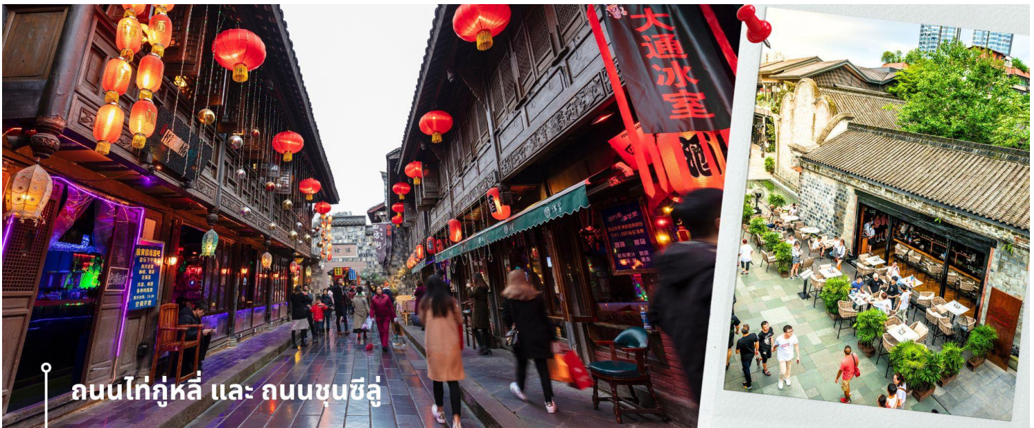
ถนนไท่กุ่หลี่ และ ถนนชุนซี้ลู่