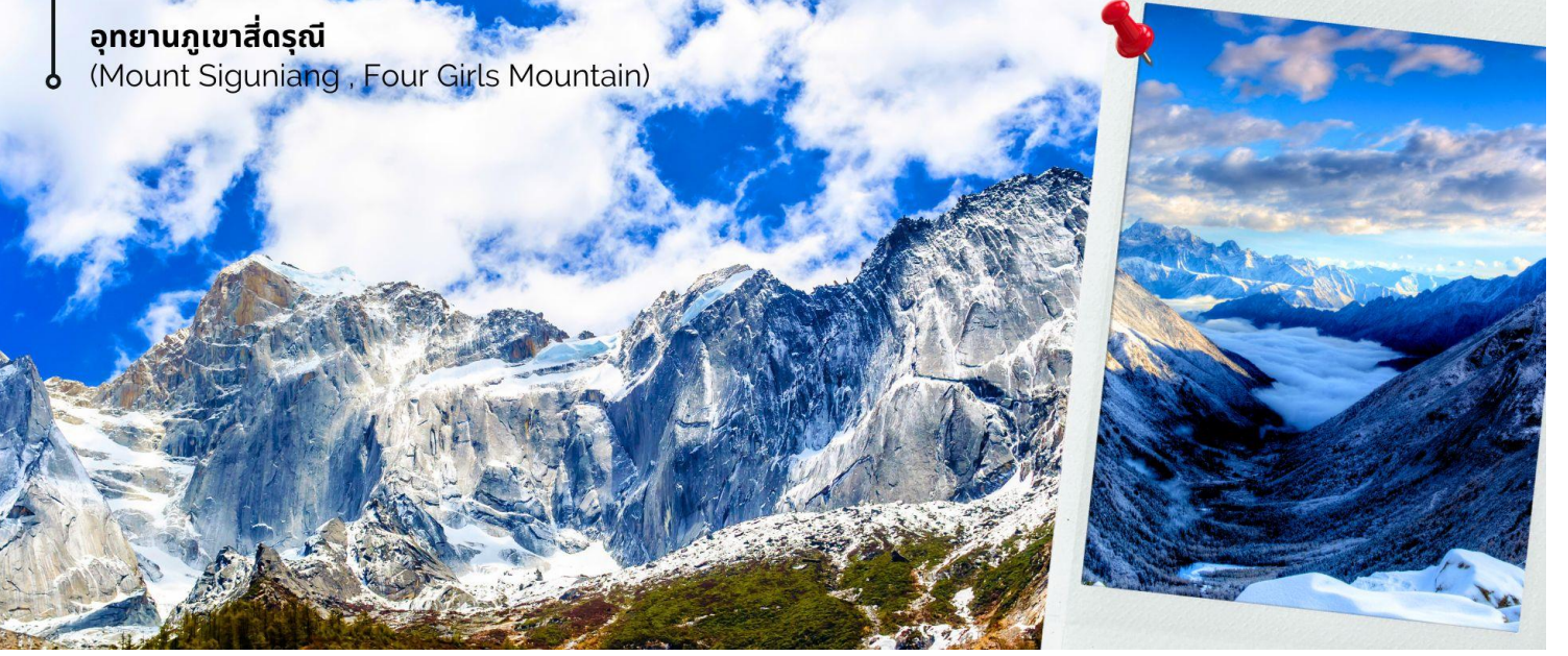
อุทยานภูเขาสี่ดรุณี (Mount Siguniang , Four Girls Mountain)

เช้า 🎯 รับประทานเช้า ณ ภัตตาคาร (2) นำท่านเดินทางสู่ อุทยานภูเขาสี่ดรุณี (Mount Siguniang หรือ Four Girls Mountain) หรือชื่อเรียกในภาษาจีนว่า 'ซื่อกุเหนียงซาน' (เดินทางด้วยรถบัสจากเมืองเฉิงตู ใช้เวลาเดินทางประมาณ 3-4 ชั่วโมง) อยู่สูงกว่าระดับน้ำทะเลราว 5,000 เมตร ตั้งอยู่ในอำเภอเสี่ยวจิน เขตปกครองตนเองชนชาติทิเบตและเซียงอาปา มณฑลเสฉวนทางตะวันตกเฉียงใต้