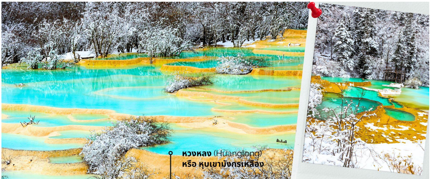
หวงหลง (Huanglong) หรือ หุบเขามังกรเหลือง

หวงหลง (Huanglong) หรือ หุบเขามังกรเหลือง (รวมค่ากระเช้าขึ้น-ลง หวงหลงและรถแบดเตอร์รี่) ที่ได้รับการขึ้นทะเบียนเป็นมรดกโลก รายล้อมไปด้วยแอ่งน้ำสีฟ้าจำนวนนับไม่ถ้วน และภูเขาสูงใหญ่สลับซับซ้อน อุทยานหวงหลง (Huanglong Scenic and Historic Interest Area) หรือ หุบเขามังกรเหลือง แหล่งธรรมชาติที่อุดมสมบูรณ์บนเทือกเขา Minshan Mountains มีระบบนิเวศที่หลากหลาย ทั้งน้ำพุร้อน น้ำตก แอ่งน้ำหินปูน รวมถึงเป็นแหล่งของพืชพรรณนานาชนิด และสัตว์ป่าใกล้สูญพันธุ์อย่าง แพนด้ายักษ์ และ ลิงจุกเขดสีทอง เป็นต้น ที่สำคัญยังมีทัศนียภาพที่สวยงามน่าทึ่งราวกับเป็นดินแดนสวรรค์ ด้วยคุณสมบัติเหล่านี้ อุทยานหวงหลงจึงได้รับการขึ้นทะเบียนเป็นมรดกโลกโดย