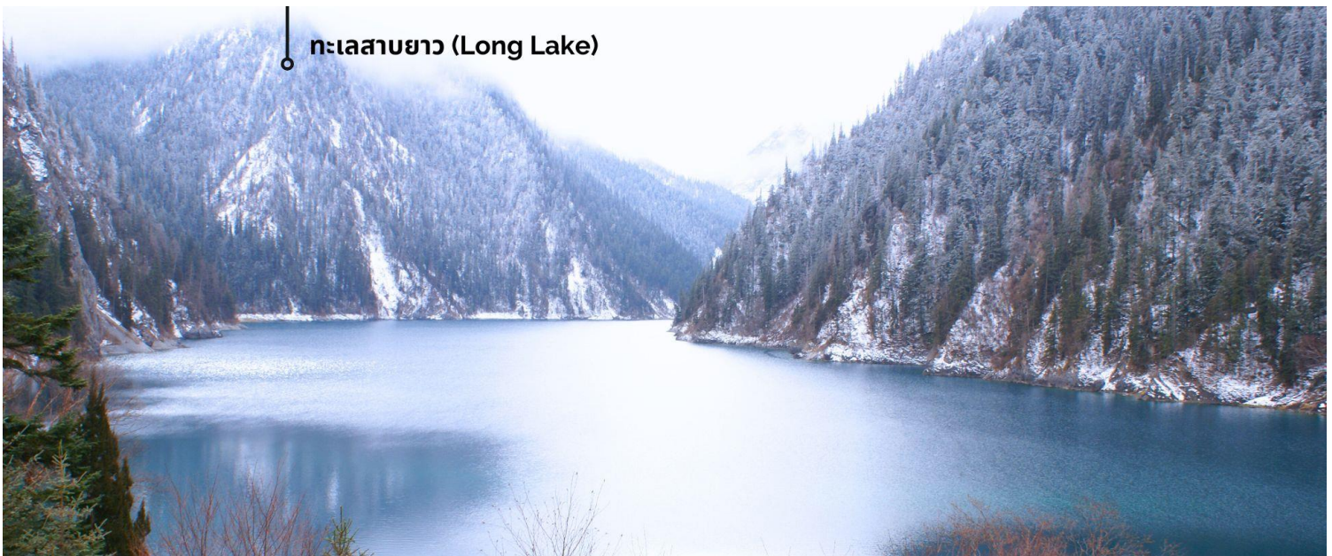
ทะเลสาบยาว (Long Lake)

ทะเลสาบที่ใหญ่ที่สุด สูงที่สุด และลึกที่สุดในจิวจ้ายโกว ด้วยเนื้อที่กว่า 581 ไร่ ความยาวกว่า 7 กิโลเมตร และลึกถึง 103 เมตร ทอดตัวโค้งเป็นรูปพระจันทร์เสี้ยว เนื่องจากหิมะบนภูเขาละลายลงมา น้ำในทะเลสาบสีฟ้าสวยงาม ล้อมรอบด้วยยอดเขาสูงชัน และต้นไม้ไม้ใหญ่ที่ปกคลุมด้วยหิมะ งดงามราวหลุดออกมาจากภาพวาด ความพิเศษในช่วงฤดูหนาว ทะเลสาบจะกลายเป็นน้ำแข็งหนากว่า 60 เซนติเมตร ทำให้นักท่องเที่ยวนิยมมาเล่นสเก็ตน้ำแข็งกันเป็นจำนวนมาก