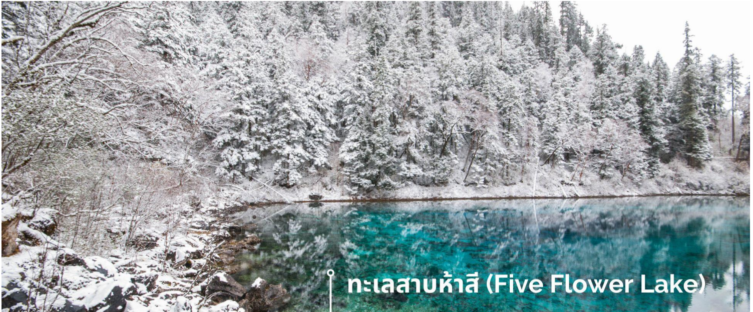
ทะเลสาบห้าสี (Five Flower Lake)

หนึ่งในจุดที่สวยงามและนักท่องเที่ยวแวะมาเยี่ยมชมเยอะที่สุด ตั้งอยู่ที่ความสูงเหนือระดับน้ำทะเลประมาณ 2,472 เมตร น้ำลึกประมาณ 5 เมตร น้ำใสจนเห็นพื้นด้านล่างของทะเลสาบ สีของผิวน้ำสวยงามแปลกตา โดยเฉพาะเมื่อยามแสงอาทิตย์สาดส่องกระทบผิวน้ำ สีของน้ำในทะเลสาบจะสะท้อนเป็นสีส้มถึง 5 เฉดสี สวยงามสะกดตา ซึ่งสาเหตุที่ทำให้เกิดสีส้มต่างๆ นี้มาจากการสะสมของแร่ธาตุ และพืชน้ำชนิดต่างๆ โดยจะมีสีส้มแตกต่างกันไปตามฤดูกาลและช่วงเวลา ยิ่งถ้ามาในช่วงฤดูหนาว ต้นไม้ริมทะเลสาบจะเต็มไปด้วยหิมะสีขาวตัดกับสีของทะเลสาบ ดูสวยงามแปลกตา