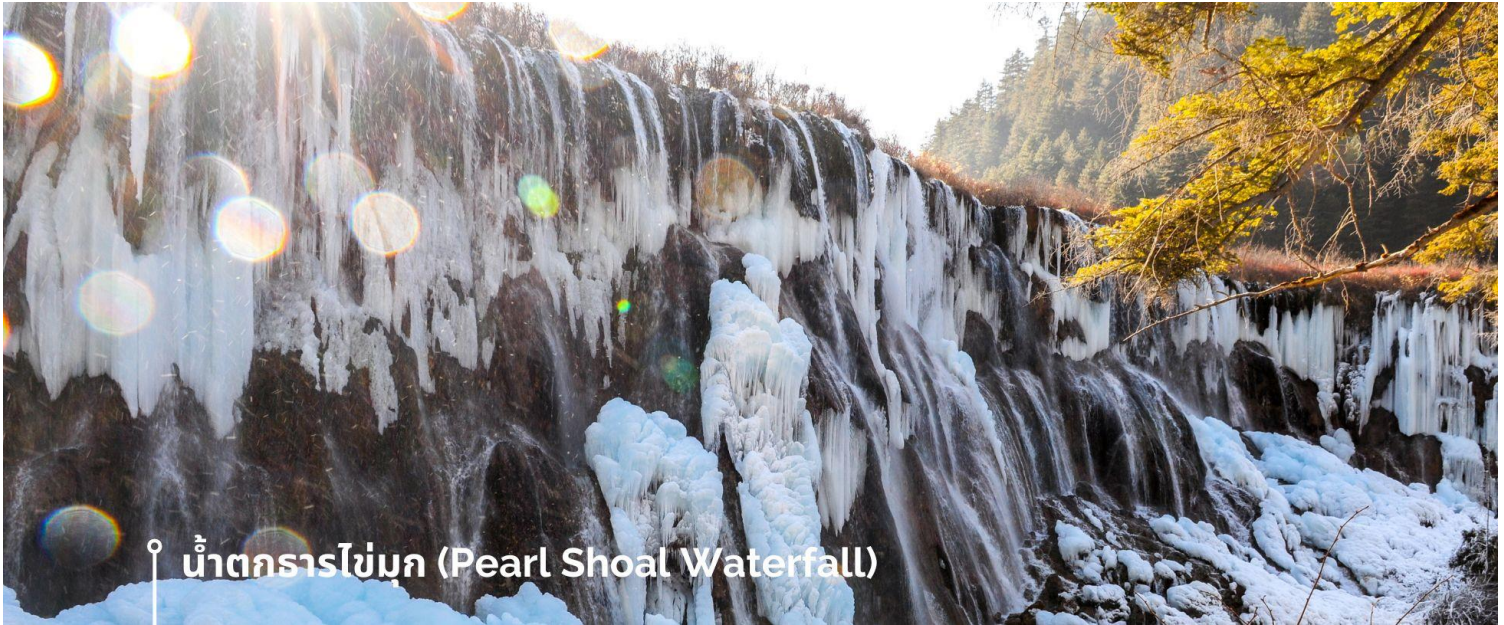
น้ำตกธารไข่มุก (Pearl Shoal Waterfall)

จากแสงแดดที่สะท้อนกับละอองน้ำอีกด้วย หากได้มาในช่วงฤดูหนาว ก็จะได้เห็นหิมะเกาะตามต้นไม้ โขดหิน และถ้าอากาศหนาวมากๆ น้ำที่น้ำตกก็จะกลายเป็นน้ำแข็ง กลายเป็นประติมากรรมจากธรรมชาติที่สวยงาม