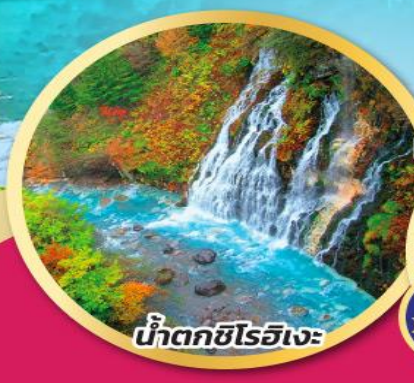
น้ำตกชิโรอิเงะ