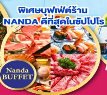
พิเศษบุฟเฟ่ต์ร้าน NANDA ดีที่สุดในซัปโปโร