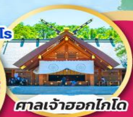
ศาลเจ้าออกโกโด