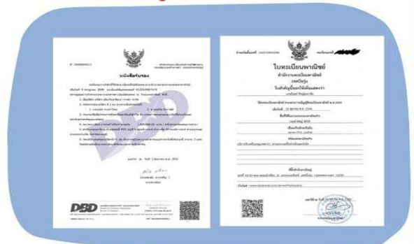
ตัวอย่างหนังสือจดทะเบียนบริษัท และ ใบทะเบียนพาณิชย์