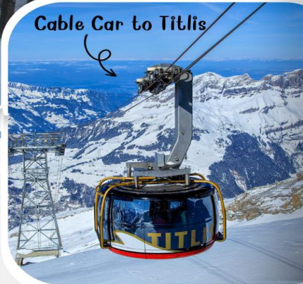
Cable Car to Titlis