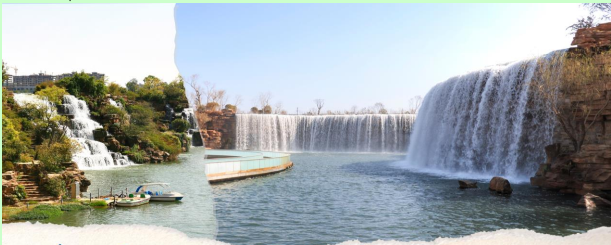
สวนน้ำตกคุนหมิง KUNMING WATERFALL PARK

จากนั้นนำท่านชมความงามและอลังการของ สวนน้ำตกคุนหมิง (KUNMING WATERFALL PARK) สวนสาธารณะใจกลางเมืองคุนหมิงแห่งนี้เปิดให้บริการเมื่อปี 2016 ถือเป็นสถานที่ท่องเที่ยวแห่งใหม่และเป็นที่พักผ่อนหย่อนใจยอดฮิตของชาวเมืองคุนหมิงเป็นสวนสาธารณะขนาดใหญ่ที่ใช้เวลาสร้างกว่า 3 ปี ภายในประกอบไปด้วยน้ำตกและทะเลสาบอีก 2 แห่ง ที่สร้างขึ้นด้วยฝีมือมนุษย์ ไฮไลต์ของสวนอย่าง น้ำตกใหญ่ยักษ์นั้น กว้างกว่า 400 เมตร และมีความสูงถึง 12.5 เมตร ถือเป็นน้ำตกฝีมือมนุษย์ที่ยาวติดอันดับของเอเชียเบื้องล่าง น้ำตกคุนหมิง เป็นทะเลสาบที่มีทางเดินพาดอยู่