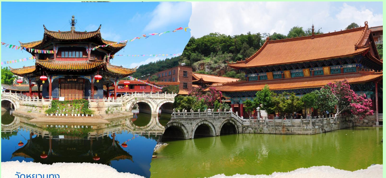
วัดหยวนตง

เดินทางสู่ วัดหยวนตง (Yuan tong Temple) เป็นวัดที่ใหญ่และเก่าแก่ที่สุดของมณฑลยูนนาน ตั้งอยู่ที่ถนนหยวนตงเจียง สร้างมาตั้งแต่สมัยราชวงศ์ถังมีอายุยาวนานประมาณ 1,200 กว่าปี ภายในวัดตกแต่งร่มรื่นสวยงาม กลางลานมีสระน้ำขนาดใหญ่ แต่การสร้างวัดแห่งนี้ดูแล้วจะแปลกตากว่าวัดอื่นๆในจีน เพราะปกติแล้วการสร้างวัดของจีนส่วนมากจะต้องสร้างอยู่บนภูเขา มีแต่วัดหยวนตงที่สร้างแปลกที่สุดในจีนคือสร้างวัดต่ำกว่าภูเขา โดยวิหารจะอยู่ต่ำที่สุด เนื่องจากวัดแห่งนี้ ไม่ได้สร้างขึ้นเพื่อเป็นวัดโดยตรง แต่เคยเป็นศาลเจ้าแม่กวนอิมมาก่อน ดังนั้นคำว่า "หยวนตง" จึงเป็นชื่อที่ปรากฏในคัมภีร์ของเจ้าแม่กวนอิม มีสะพานข้ามไปสู่ศาลาแปดเหลี่ยมกลางสระน้ำมรกต มีทั้งปลา, เต่าอยู่มากมาย ศาลาหลังนี้ผู้ชนกุ้ยสร้างในสมัยราชวงศ์ชิง ในศาลาประดิษฐาน "เจ้าแม่กวนอิมพันกร และเจ้าแม่กวนอิมพม่า หรือเรียกว่า "เจ้าแม่กวนอิมหยก"