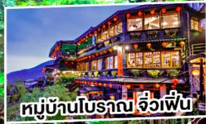
หมู่บ้านโบราณ จิวเฟิ่น