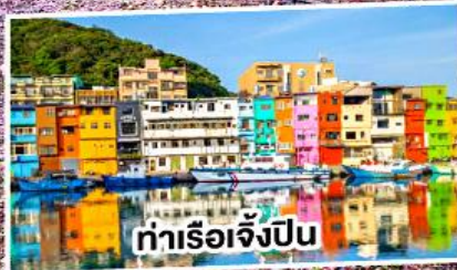
ท่าเรือเจิ้งปิ่น