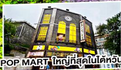
POP MART ใหญ่ที่สุดในไต้หวัน