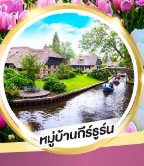
หมู่บ้านกัร์ธูร์น