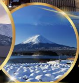
สวน โออิชิ พาร์ค

55,919 ราคาเริ่มต้น บาท รวมภาษีมูลค่าเพิ่ม 7%