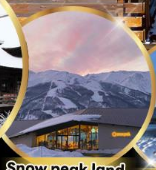
Snow peak land hukuba