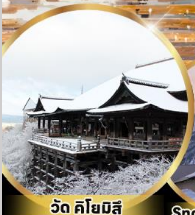
วัด คิโยมิสึ