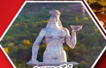
อนุสาวรีย์ มารดาแห่งจอร์เจีย