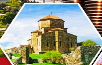
วิหารจวารี