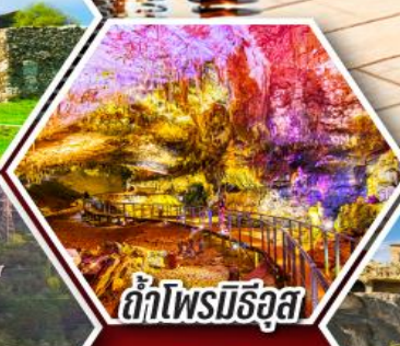
ด้าไฟรมีริอุส