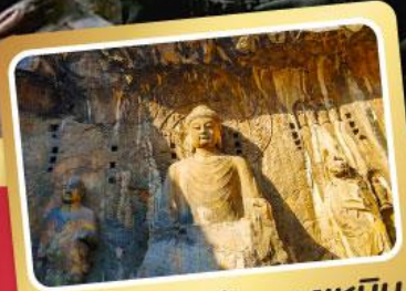
ผาแกะสลักหลงเหมิน