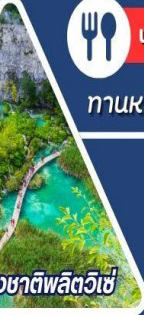
อุทยานแห่งชาติพลิทวิเซ่