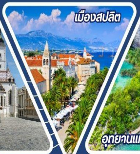
เมืองสปลิต