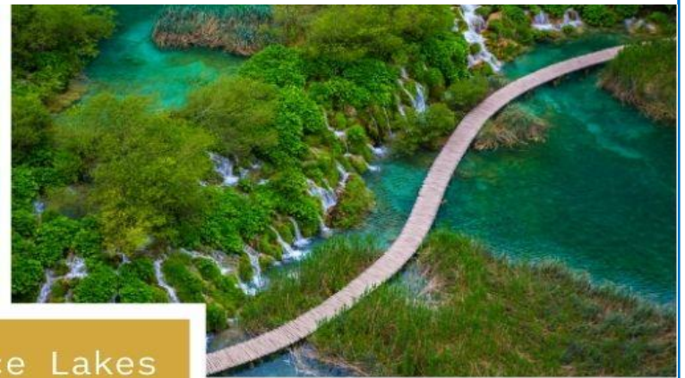
Plitvice Lakes National Park