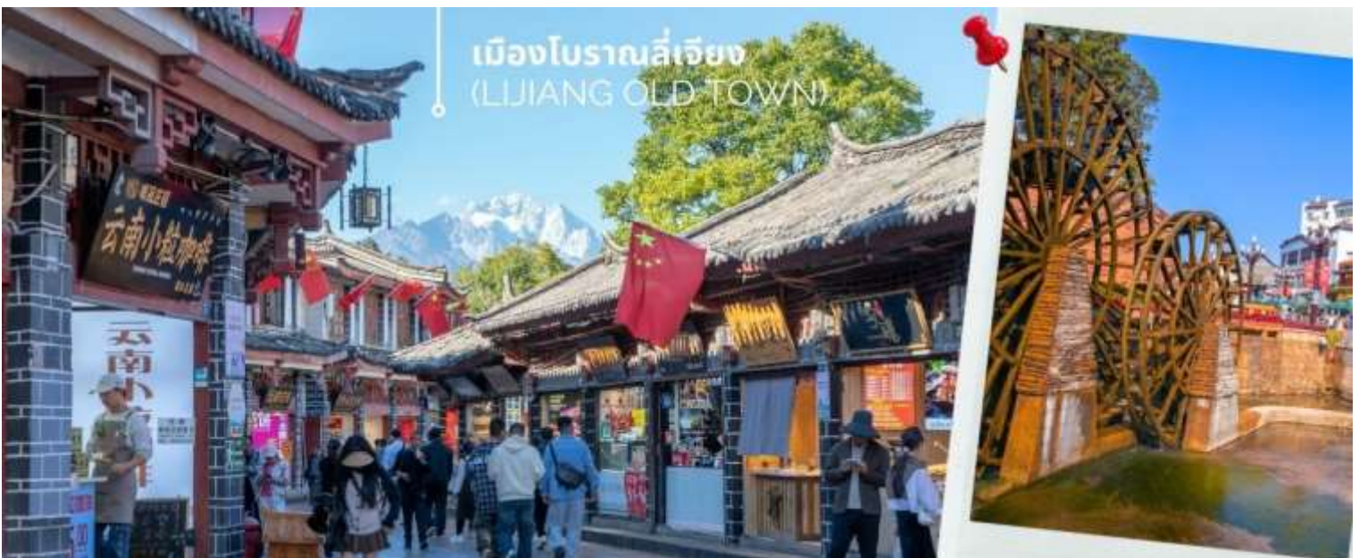
เมืองโบราณลี่เจียง (LIJIANG OLD TOWN)

นำท่านเดินทางชม เมืองโบราณลี่เจียง (LIJIANG OLD TOWN) หรือ เมืองโบราณต้าเอี้ยนเจิ้น เมืองเก่าแก่อายุกว่า 800 ปี ซึ่งภายในเมืองเก่านี้ยังคงมาไปด้วยสถาปัตยกรรมบ้านเรือนสไตล์จีนเก่าแก่ที่หาชมได้ยาก และได้รับการอนุรักษ์ไว้เป็นอย่างดี บางหลังเหมือนโรงเตี๊ยมโบราณที่เคยเห็นตามหนังจีนย้อนยุค บ้านเรือนส่วนใหญ่ถูกปรับเปลี่ยนให้กลายเป็น