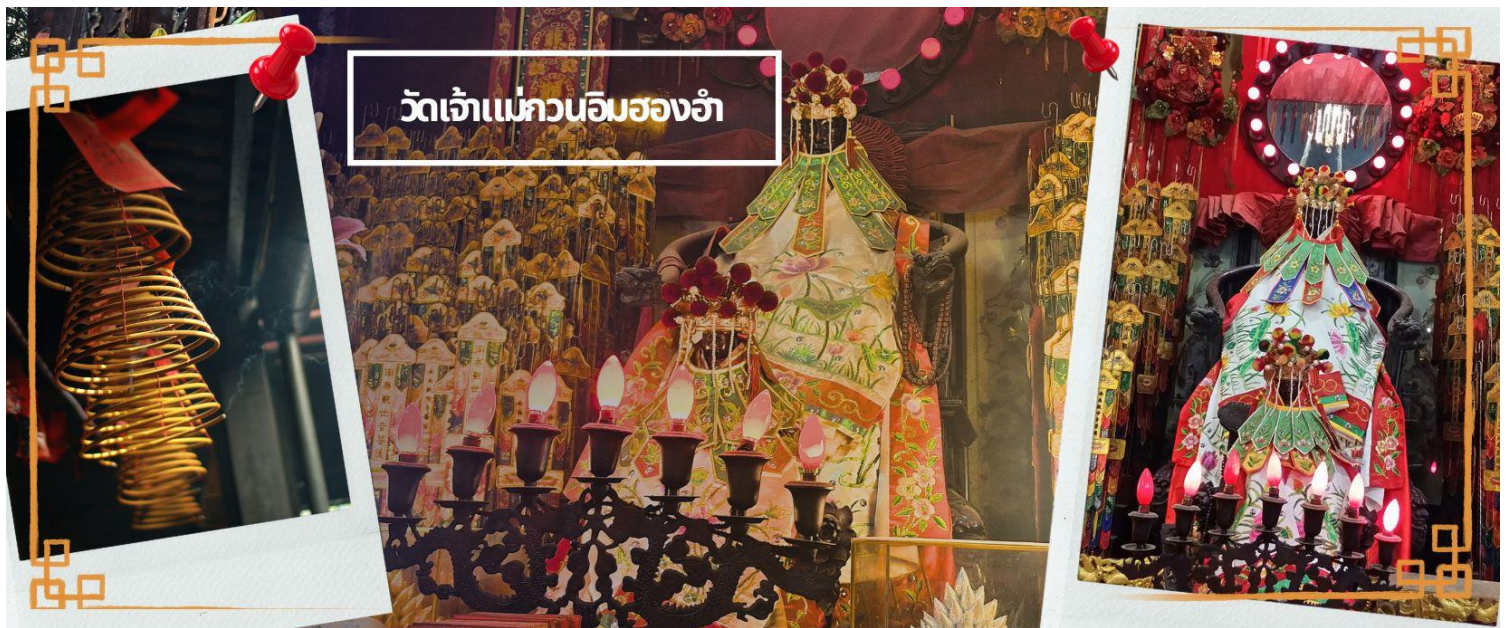
วัดเจ้าแม่กวนอิมสองห้า

จากนั้นนำทุกท่านเดินทางสู่ วัดเจ้าแม่กวนอิมสองห้า (HUNG HOM KWUN YUM TEMPLE) เป็นหนึ่งในวัดที่ชาวฮ่องกงนั้นเลื่อมใสกันมาก ด้วยความที่เจ้าแม่กวนอิมนั้นเป็นเทพเจ้าแห่งความเมตตา ฉะนั้นเมื่อใครมีทุกข์ร้อนอะไรก็มักจะมากกราบไหว้ขอพรให้เจ้าแม่ช่วยเหลือ วัดนี้ถูกสร้างขึ้นในปี ค.ศ.1873 ในช่วงสงครามโลกครั้งที่ 2 มีการปล่อยระเบิดลงบริเวณวัดสองห้าหลายต่อหลายครั้ง ทำให้มีผู้บาดเจ็บและล้มตายมากมาย แต่ชาวบ้านที่หนีเข้าไปหลบภัยในวัดนี้ก็กลับปลอดภัยและตัววัดก็ไม่ได้รับความเสียหายจากเหตุการณ์ทิ้งระเบิดอย่างน่าอัศจรรย์ และวันสำคัญอีกวันหนึ่งที่คนหลังไหลมาไหว้ขอพรอย่างไม่ขาดสาย และรอคอยเป็นประจำทุกปี ก็คือ "วันเปิดทรัพย์" หรือ วันยืมเงินเทพเจ้า เป็นวันที่จะมาขอพรและยืมเงินเจ้าแม่กวนอิม ซึ่งตรงกับวันที่ 26 นับจากวันตรุษจีน ซึ่งพิธีนี้ใน 1 ปี มีเพียงครั้งเดียวเท่านั้น