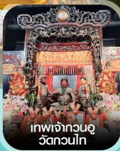
เทพเจ้ากวนอู วัดถวณโก