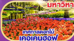
เทศกาลดอกไม้ เคอเคนฮอฟ

พิเศษ!! เมฆหอยแมลงภู่อบไวน์ขาวและขาหมูเยอรมัน