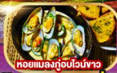
หอยแมลงภู่อบไวน์ขาว