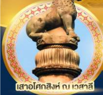
เสาสโศกสิงห์ ณ เวสาลี