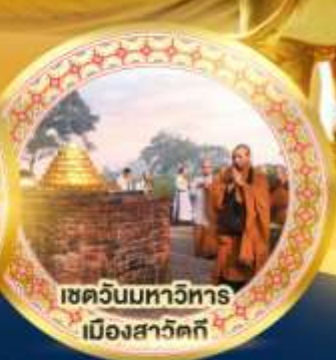
เขตวันมหาวิหาร เมืองสาวิคคี