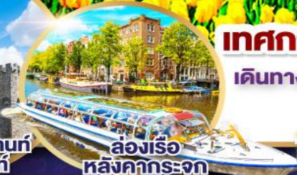
ล่องเรือหลังคากะจก