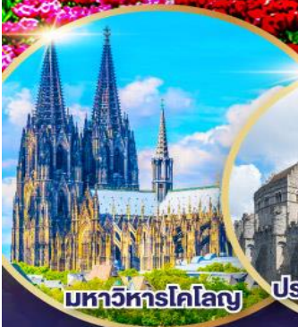
มหาวิหารโคโลญ