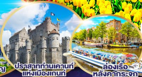
ปราสาทท่านเคานท์แห่งเมืองเกนท์