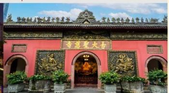
วัดต้าฉ้อ