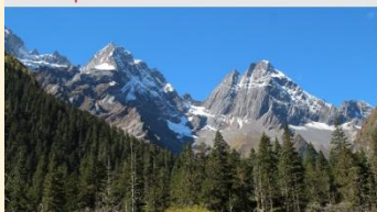
ภูเขาสี่ดรุณี (หุบเขาชวงเฉียวโกว)