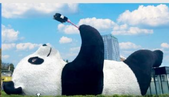
รูปปั้นหมีแพนด้าบนเซลฟี่