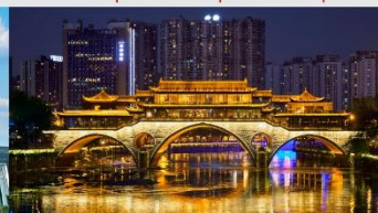
สะพานอันซุน