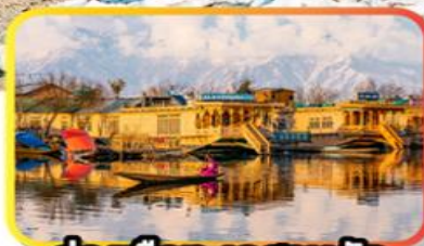
ล่องเรือทะเลสาบคิล