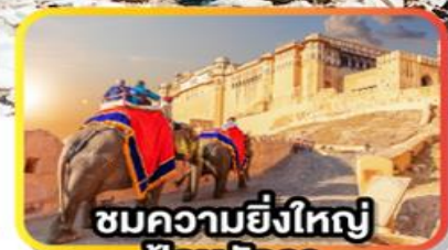
ชมความยิ่งใหญ่ ป้อมอัครา