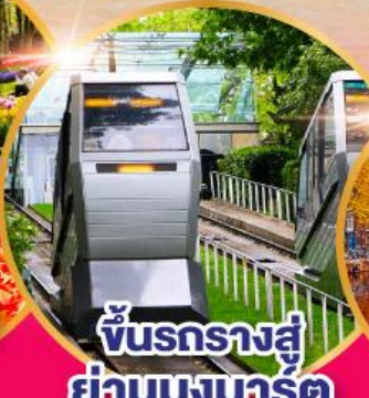
ขัั้นรางสู่ ย่านมงมาร์ต