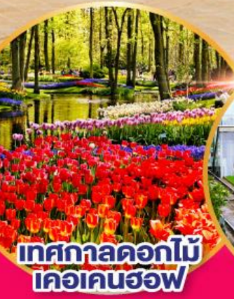
เทศกาลดอกไม้ เคอเคนฮอฟ