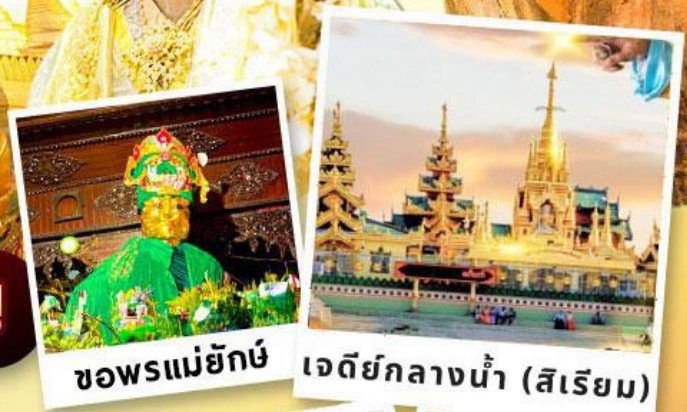
ขอพรแม่ยักษ์