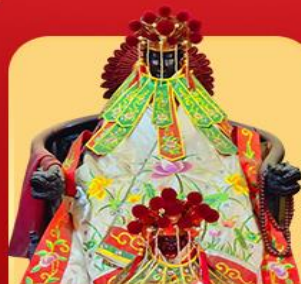
เจ้าแม่กวนอิมสองอ้า