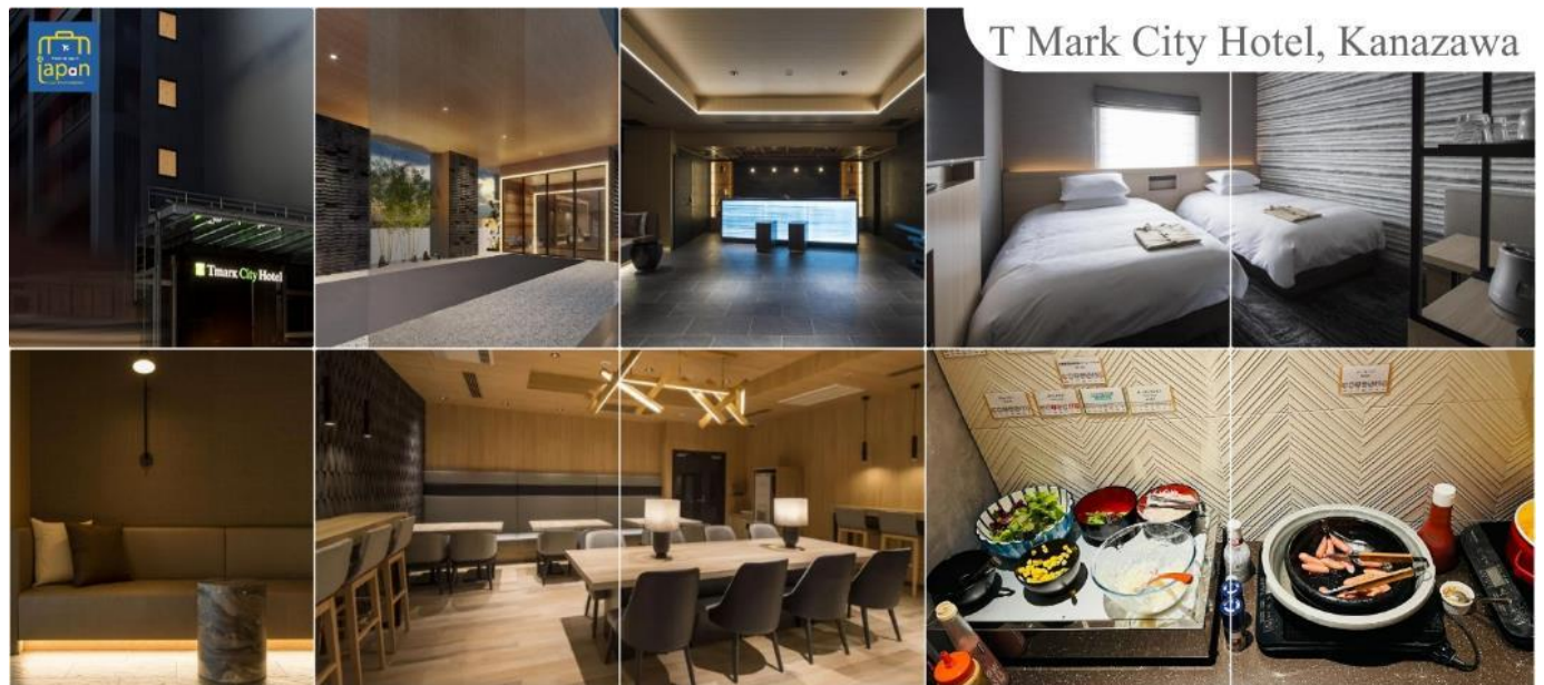
T Mark City Hotel, Kanazawa

T MARK CITY HOTEL, KANAZAWA หรือเทียบเท่าระดับเดียวกัน