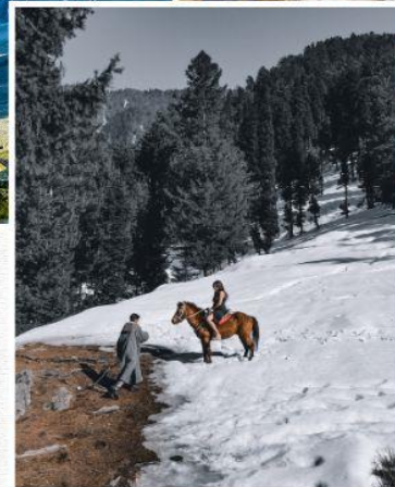
Nishat Bagh Mughal Garden PAHALGAM KASHMIR

นำท่าน ชม สวนชาลิมาร์ ที่สร้างขึ้นสมัยราชวงศ์โมกุลในเมืองศรีนาคา แคชเมียร์เป็น แคว้นที่มีชื่อเสียงในการจัดสวนตามแบบสมัยของราชวงศ์โมกุล เนื่องจากภูมิอากาศเย็นเหมาะสมในการเจริญเติบโตของต้นไม้ดอกไม้ จึงกลายเป็นที่ประทับพักผ่อนของกษัตริย์ราชวงศ์โมกุลในอดีต สวนชาลิมาร์แห่งนี้เป็นส่วนแห่งความรักสร้างโดยจักรพรรดิชาฮังคี น้ำพุภายในสวนเกิดขึ้นได้โดยแรงดันน้ำธรรมชาติที่มาจากภูเขา ในช่วงฤดูร้อนท่านจะได้พบกับดอกไม้บานาพรรณ รวมทั้งต้นซีนาร์ (ชื่อต้นไม้ที่เรียกตามท้องถิ่น) หรือ ต้นเมเปิ้ล ขนาดใหญ่ในสวนแห่งนี้ บางต้นมีอายุกว่า 300-400 ปี จากนั้นชม สวนนิชาน ตั้งอยู่บนฝั่งของทะเลสาบดาล มีภูเขาซาร์บาวาลตั้งเป็นฉากหลัง เป็นสวนที่ใหญ่ที่สุด มีต้นเมเปิ้ลอายุกว่า 400 ปี รวมถึงดอกไม้สวรรค์ ที่หาพบเห็นได้ยาก และดอกไม้บานาชนิดตามฤดูกาล ตัดไม้กับบรรยากาศยามพระอาทิตย์ตกดิน และหนุ่มสาวแคชเมียร์ที่มักใช้สถานที่แห่งนี้เป็นที่นัดหมาย