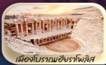
เมืองโบราณฮัยราโพลิส