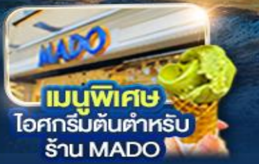
เมนูพิเศษ ไอศกรีมต้นตำหรับ ร้าน MADO