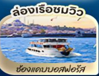
ช่องแคบบอสฟอรัส