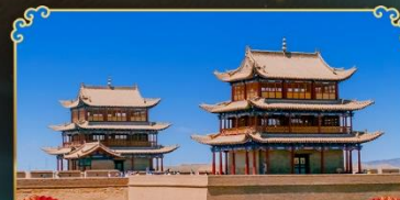
กำแพงเมืองจีนเจียววักกวน