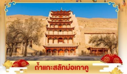
กำแพงสลักม่อเกาคู

เดินทางโดย : สายการบินโบไห่แอร์ไลน์ & เซี่ยงไฮ้แอร์ไลน์