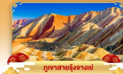
ภูเขาสายรุ้งจางเย่