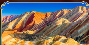
ภูเขาสายรุ้งจางเย่

เดินทางตามรอยเส้นทางสายประวัติศาสตร์โลก ชมโอเอซิสกลางทะเลทราย "ทะเลสาบพระจันทร์เสี้ยว"