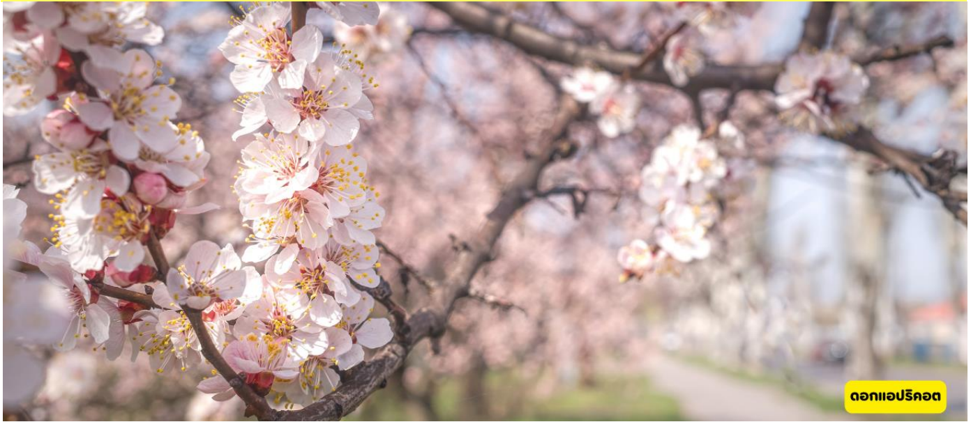
ดอกแอปริคอต

วันที่ห้า ด่านขุนจิราบด้านที่สูงที่สุดในโลก - ถนนโบราณผานหลง - ทะเลสาบปันตี้ - เมืองทัชคอร์گان - จุดชมวิวยักษ์สีทอง - หมู่บ้านดอกแอปริคอต