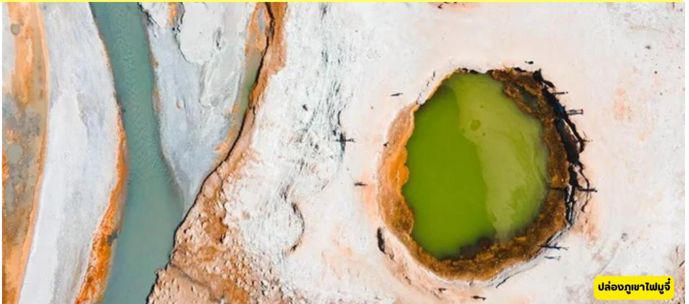
ปล่องภูเขาไฟมูจี

เมืองทัชคอร์กัน – เมืองมูจี - ปล่องภูเขาไฟมูจี - อุทยานน้ำแข็งออยตัก (Aoyi Take Glacier Park) - ชมโชว์พื้นเมือง