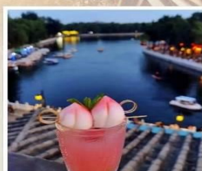
TANG FANG CAFE