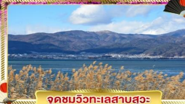
จุดชมวิวกะเลสาบสุวะ