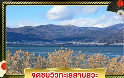
จุดชมวิวกะเลสาบสุวะ