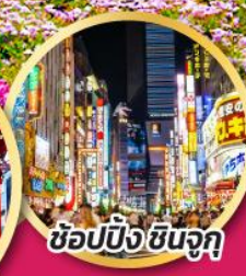
ช้อปปิ้ง ชินจูกุ

เทศกาลฟูจิ ชิบะซากุระ เฟสติวัล (PINKMOSS)