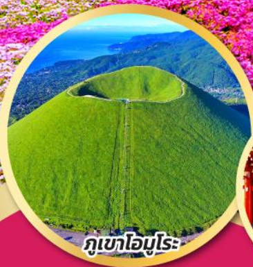
ภูเขาโอโมโร