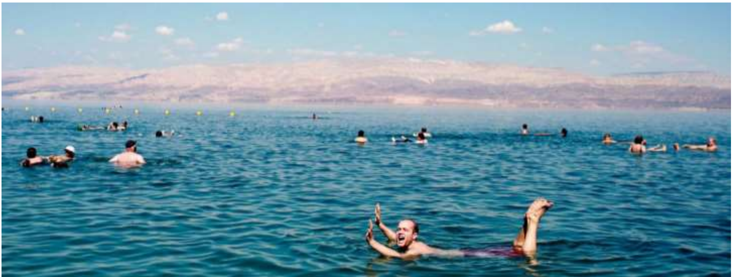
(การลงเล่นน้ำในทะเลเดดซีนั้นมีข้อควรระวังต่าง ๆ ควรฟังคำแนะนำจากมัคคุเทศก์ท้องถิ่น และหัวหน้าทัวร์)

ระหว่างทางแวะให้ท่านได้ ช้อปปิ้งที่ร้านจำหน่ายผลิตภัณฑ์ที่ทำจากเดดซี เช่น โคลนพอกตัว พอกหน้า สบู่ และสินค้าอื่นที่ทำจากเดดซีอีกมากมาย จากนั้นนำท่านเดินทางเข้าสู่โรงแรมที่พักเพื่อทำการเช็คอิน และ อีสรระพักผ่อน ลงเล่นน้ำทะเลและพิสูจน์ความจริงว่าท่านสามารถลอยตัวในน้ำทะเลแห่งนี้ได้จริงหรือไม่ ให้ท่านเลือกบำรุงผิวพรรณโดยการพอกโคลนจากทะเลเดดซี หรือเลือกพักผ่อนตามอัธยาศัยภายในบริเวณโรงแรมที่พัก