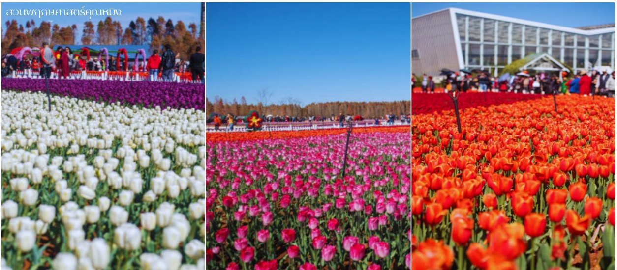
สวนพฤกษศาสตร์คุณหญิง

คณะเดินทาง เดือน ก.พ.68 นำท่านชมสวนดอกทิวลิป นำชมดอกทิวลิปนับล้านดอกในสวนพฤกษศาสตร์คุณหญิงสวนสาธารณะฯ ได้เพาะปลูกทิวลิป 18 สายพันธุ์ รวมอยู่ที่ราว 80,000 ดอก อีสาระให้ท่านได้เดินชมบรรยากาศและเก็บความความสวยงามและประทับใจ