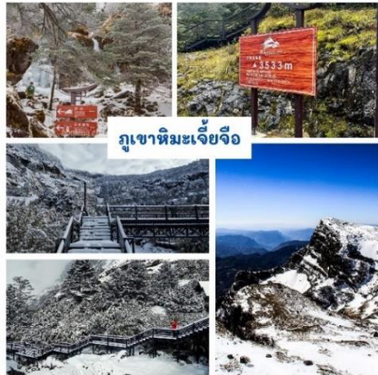
ภูเขาหิมะเจียจื่อ

หมายเหตุ** ปริมาณหิมะขึ้นอยู่กับสภาพอากาศในช่วงที่เดินทางเท่านั้นเท่านั้น!!