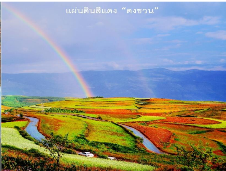
แผ่นดินสีแดง “ตงชว่น”