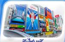
ชินไซบาชิ