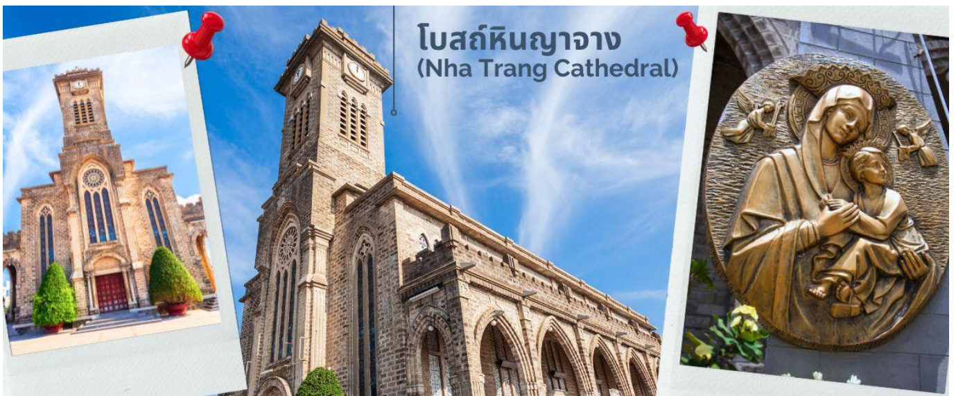
โบสถ์หินญาง (Nha Trang Cathedral)

พาท่านชม โบสถ์หินญาง (Nha Trang Cathedral) เป็นโบสถ์ที่ใหญ่ที่สุดในเมืองญาง ตั้งโดดเด่นอยู่บนเนินสูง 10 เมตร ห่างจากทะเลเพียงแค่ 1 กิโลเมตร โบสถ์หลังนี้ถูกสร้างขึ้นในสไตล์ฝรั่งเศสโกธิก ภายในโบสถ์ถูกตกแต่งด้วยกระจกสีที่มีสีสันสวยงาม พื้นที่ภายในโบสถ์จะมี 760 ตร.กม. สามารถบรรจุคนได้ถึง 600 คน ตัวโบสถ์ถูกสร้างด้วยบล็อกซีเมนต์ และใช้หินในการปูพื้น