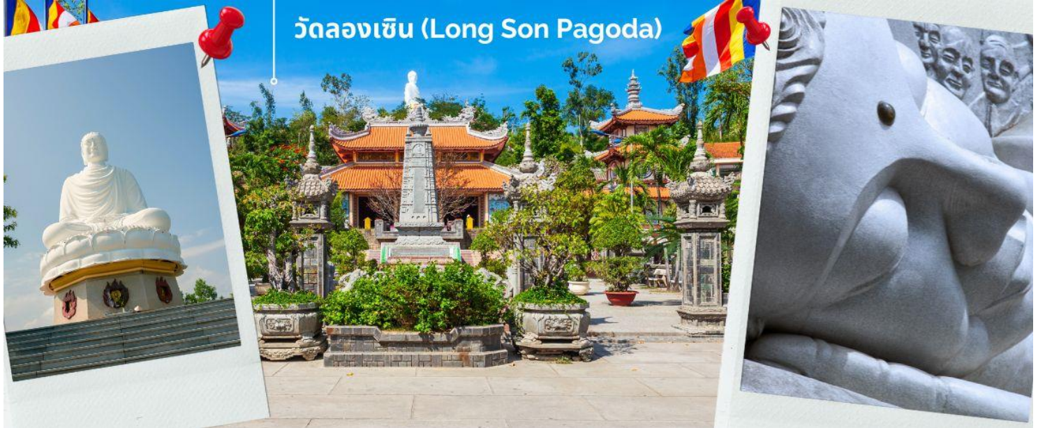
วัดลองเซิน (Long Son Pagoda)

พาท่านชม โบสถ์หินญาง (Nha Trang Cathedral) เป็นโบสถ์ที่ใหญ่ที่สุดในเมืองญาง ตั้งโดดเด่นอยู่บนเนินสูง 10 เมตร ห่างจากทะเลเพียงแค่ 1 กิโลเมตร โบสถ์หลังนี้ถูกสร้างขึ้นในสไตล์ฝรั่งเศสโกธิก ภายในโบสถ์ถูกตกแต่งด้วยกระจกสีที่มีสีสันสวยงาม พื้นที่ภายในโบสถ์จะมี 760 ตร.กม. สามารถบรรจุคนได้ถึง 600 คน ตัวโบสถ์ถูกสร้างด้วยบล็อกซีเมนต์ และใช้หินในการปูพื้น