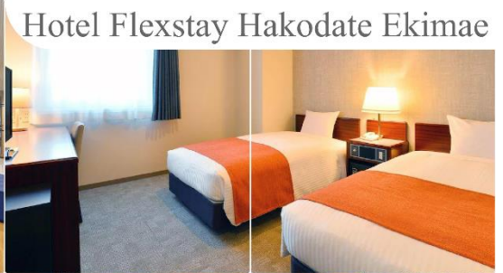
Hotel Flexstay Hakodate Ekimae