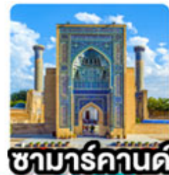
ซามาร์คานด์