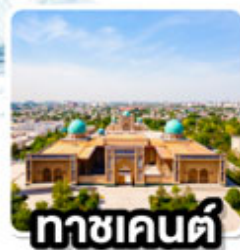
ทาชเคนต์