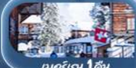
เมอร์เรน 1 คืน

" เปิดประสบการณ์ก่อนใคร ขึ้นกระเช้าที่ชันที่สุดในโลกล่าสุด!! Schilthornbahn 20XX " และขึ้นกระเช้า Eiger Express พิชิตยอดเขาจุงเฟรา TOP OF EUROPE เยือนหมู่บ้านเซอร์แมท ชมวิวยอดเขาแมทเทอร์ฮอร์น น้ำพุจรดเจ็ทโด ศาลาไทย ชาลี แฮปปีน The Fork ทะเลสาบสีฟ้าเบลลาเซ น้ำตกกลางหมู่บ้านเลาทอร์บรุนเนิน เมืองลูเซิร์น สิงโตหินแกะสลัก สะพานไม้ชาเปลา และเมืองชุกเมืองริมทะเลสาบ