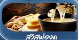
สวิสฟองดู