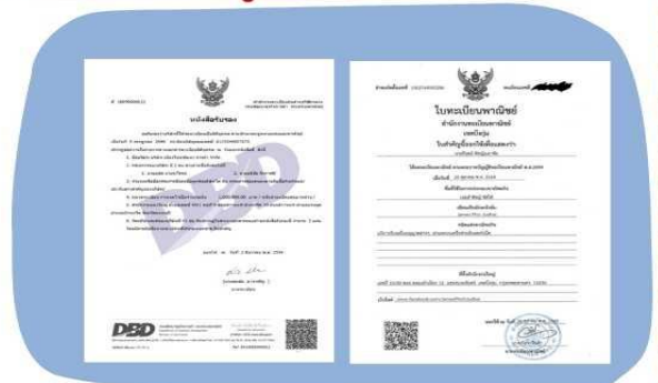
ตัวอย่างหนังสือจดทะเบียนบริษัท และ ใบทะเบียนพาณิชย์