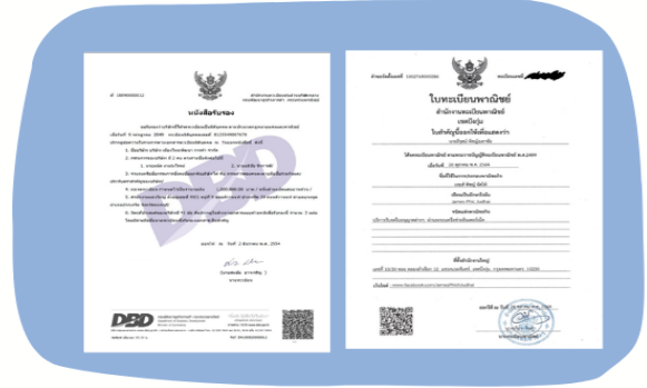
ตัวอย่างหนังสือจดทะเบียนบริษัท และ ใบทะเบียนพาณิชย์