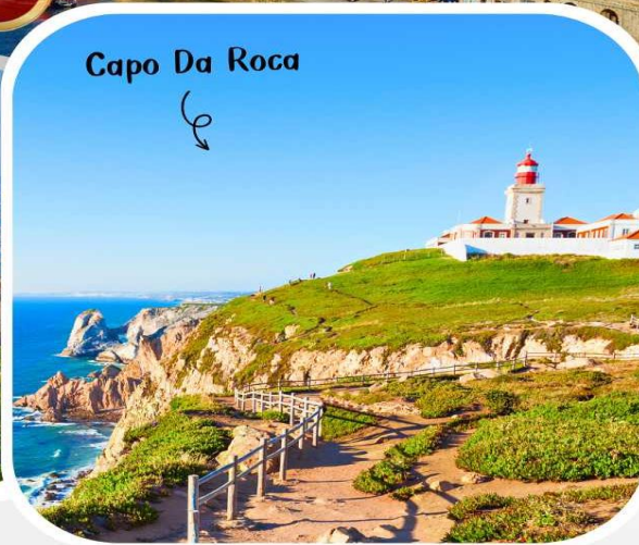
Capo Da Roca