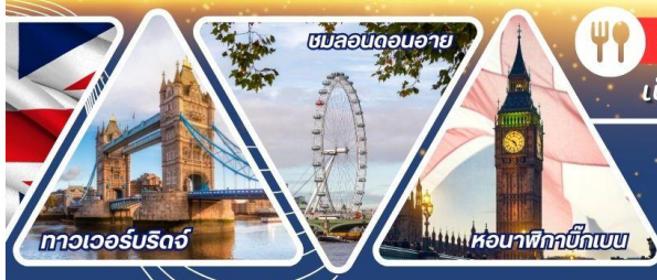
ทาวเวอร์บริดจ์