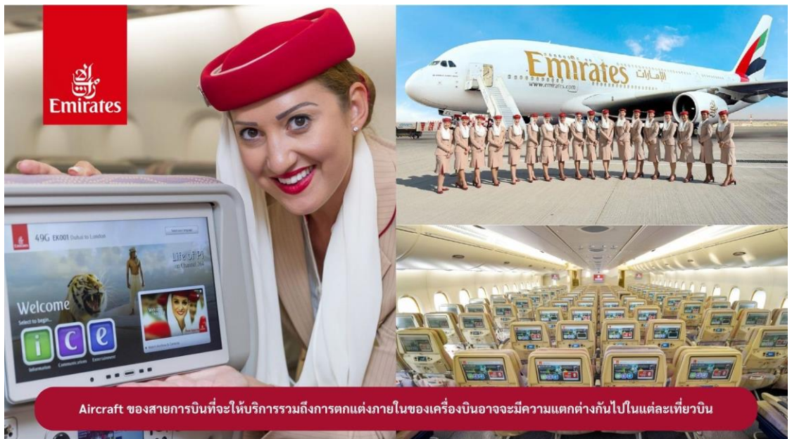
Aircraft ของสายการบินที่จะให้บริการรวมถึงการตกแต่งภายในของเครื่องบินอาจมีความแตกต่างกันไปในแต่ละเที่ยวบิน

21.05 น. ออกเดินทางสู่ เมืองดูไบ ประเทศสหรัฐอาหรับเอมิเรตส์ โดยสายการบินเอมิเรตส์ เที่ยวบินที่ EK373 (🍽️ บริการอาหารและเครื่องดื่มบนเครื่องบิน)