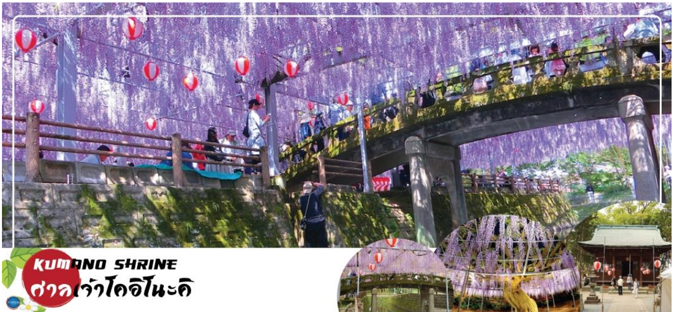
KUMANO SHRINE ศาลเจ้าโคโตะโนะอิ

จากนั้นเดินทางสู่ เมืองยานะกาว่า (Yanagawa) ตั้งอยู่ทางตอนใต้ของจังหวัดฟูกูโอกะ ลักษณะเด่นของเมืองยานากาว่า คือเป็นเมืองน้ำที่มีคูคลองไหลผ่านเช่นเดียวกับเมืองเกียวโต อีกทั้งคูคลองที่ตัดผ่านตัวเมือง ยังมีรูปร่างเป็นเหลี่ยม มีมุมตัดเข้ากับโค้งเว้าของชอกชอยที่เป็นหมู่บ้านของชาวญี่ปุ่นตั้งแต่ในสมัยก่อนที่จะสร้างเป็นเมือง จนมาถึงสมัยปัจจุบัน