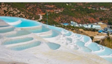
ระเบียงธารน้ำขาว "ไป๋ส่วยโต"