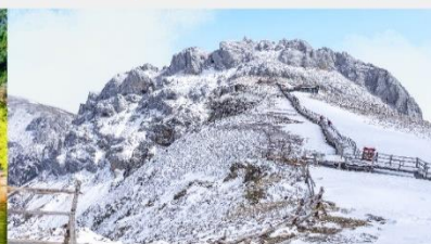
กุเขาคิมะสื่อซ่า