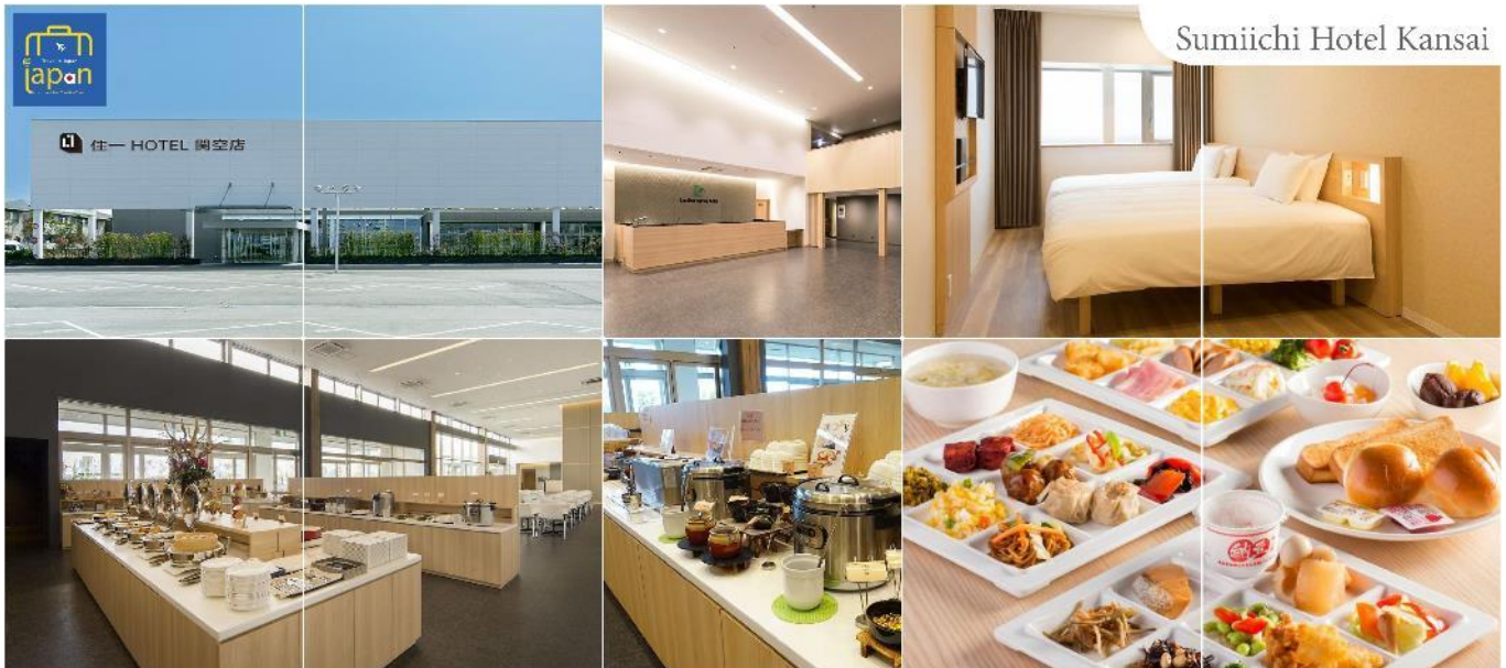
Sumiichi Hotel Kansai

พักที่ SUMIICHI HOTEL KANSAI หรือเทียบเท่าระดับเดียวกัน