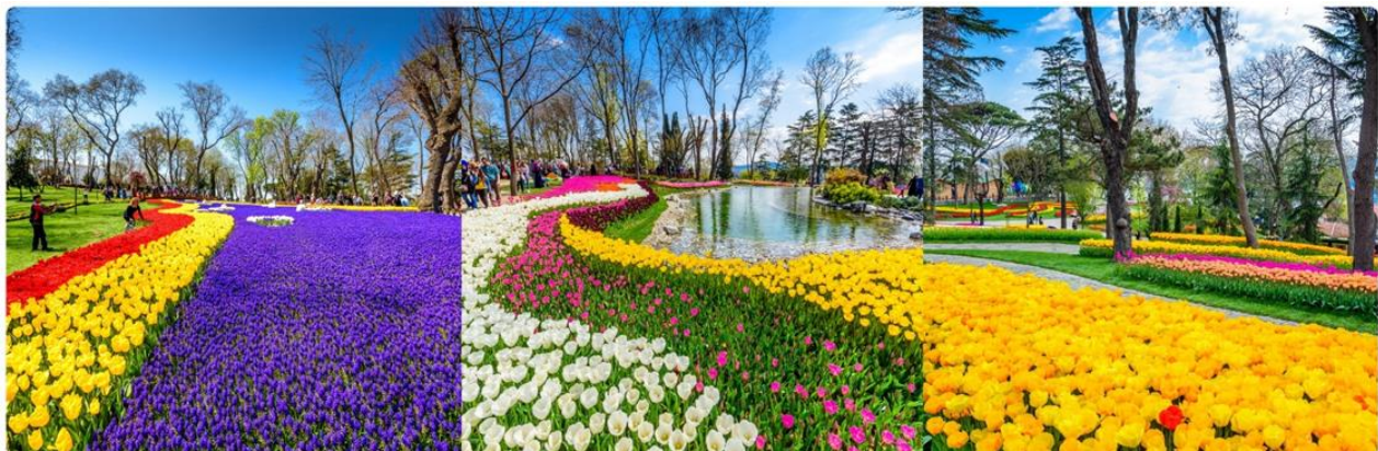
*ภาพเพื่อการโฆษณาเท่านั้น

นำทุกท่านเข้าชม สวนดอกทิวลิป (เทศกาลดอกทิวลิปเปิดให้เข้าชมระหว่างวันที่ 1-30 เมษายนเท่านั้น) สวนดอกทิวลิปหลากสีหลายสายพันธุ์นับล้านดอกที่สวยงามที่สุด และมีชื่อเสียงที่สุดของตุรกี ตลอดเดือนเมษายน เทศกาลทิวลิปอิสตันบูล เป็นเทศกาลประจำปี โดยจะจัดในช่วง 3 สัปดาห์สุดท้ายของเดือนเมษายน เพื่อเฉลิมฉลองทั้งฤดูใบไม้ผลิ และความสำคัญของดอกทิวลิป ที่มีต่ออาณาจักรออตโตมัน และวัฒนธรรมตุรกี ปกติแล้วเทศกาลนี้จัดขึ้นที่สวนสาธารณะ ที่มีชื่อเสียงที่สุดของเมือง ให้ทุกท่านได้ถ่ายรูปตามอัธยาศัย