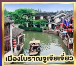
เมืองโบราณจูเจียเจียว