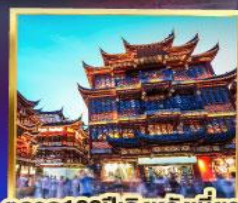
ตลาด100ปีเอ็งหวังเมี่ยว