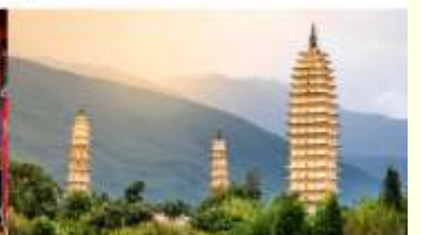
เจดีย์สามองค์

*ทางบริษัทฯ ขอสงวนสิทธิ์ในการสลับโปรแกรมทัวร์ตามความเหมาะสมขึ้นอยู่กับสถานการณ์หน่วยงาน โดยคำนึงถึงผลประโยชน์ของลูกค้าเป็นสำคัญ