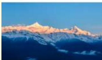
กูเขาศิมะเหมยลี่